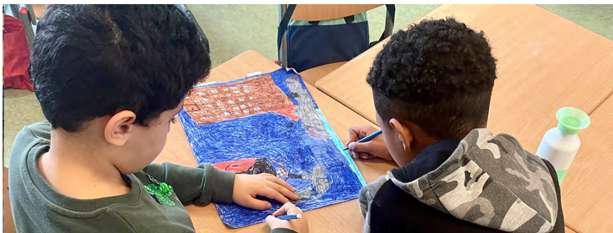
Ontwerp je eigen decor - gree screen workshop bij Op Avontuur

In 2024 waren we aanwezig op 10 verschillende basisscholen uit verschillende wijken en verschillende achtergronden: Al-Amana (Leidsche Rijn), Da Costaschool (Hoograven), De Beiaard, (Tuindorp-Oost), De Piramide (Zuilen), Eben-Haezerschool (Leidsche Rijn), Het Schateiland (Kanaleneiland), Jenaplanschool Zonnewereld (Leidsche Rijn), KC Rijnvliet (Leidsche Rijn), Lukasschool (Kanaleneiland) en Op Avontuur (Lunetten).