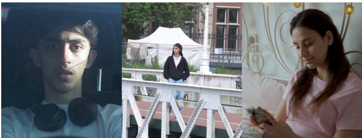
Common Frames Showcases

Zo gaven we in november een aantal jonge makers van Common Frames de ruimte om hun werk te tonen aan het publiek. Dit leidde tot mooie gesprekken over de films en over de achtergrond van de makers.