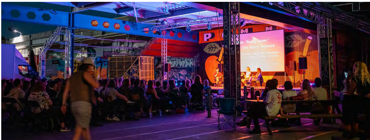
Hoogt op Beton-T

De Stichting stelt zich ten doel de belangstelling voor film- en mediakunst in de ruimste zin van het woord, al dan niet in samenwerking met derden, te bevorderen. Zij streeft ernaar dit doel te bereiken door onder meer het organiseren van filmvoorstellingen, (film)concerten, debatten, lezingen, cursussen, retrospectieven en andere culturele evenementen. Daartoe vertoont de stichting zo mogelijk premièrefilms, blikt terug op het verleden middels filmerfgoed én schenkt aandacht aan nieuwe ontwikkelingen. Stichting Filmtheater 't Hoogt onderzoekt hiertoe ook voortdurend de nieuwste presentatievormen en probeert die toe te passen. De stichting realiseert haar doelstelling verder door samenwerkingsverbanden in de stad te zoeken en aan te gaan, ontwikkelt educatieve programma's voor diverse doelgroepen en voert deze uit.