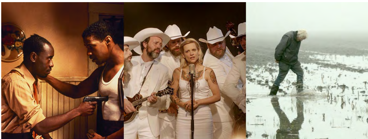
Black Achievement Month (Devil in a Blue Dress) - Tröst (The Broken Circle Breakdown) - Festival Europa (Gerlach)

We toonden onder andere de films die bij verschillende soorten van rouwverwerking aansloten: Close, Mijn grote broer, The Broken Circle Breakdown en Trois Couleurs: Bleu.