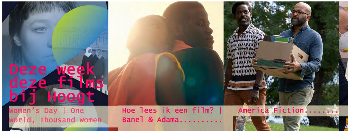
Filmagenda op instagram

Meer nog dan in de voorgaande jaren hebben we in 2024 de focus gelegd op Instagram. Daar is onze doelgroep (nog steeds) aanwezig. Ons account blijft groeien, met 6,8% over heel 2024, waar het aantal volgers op Facebook en X (vergelijkbaar met de landelijke trend) afneemt.