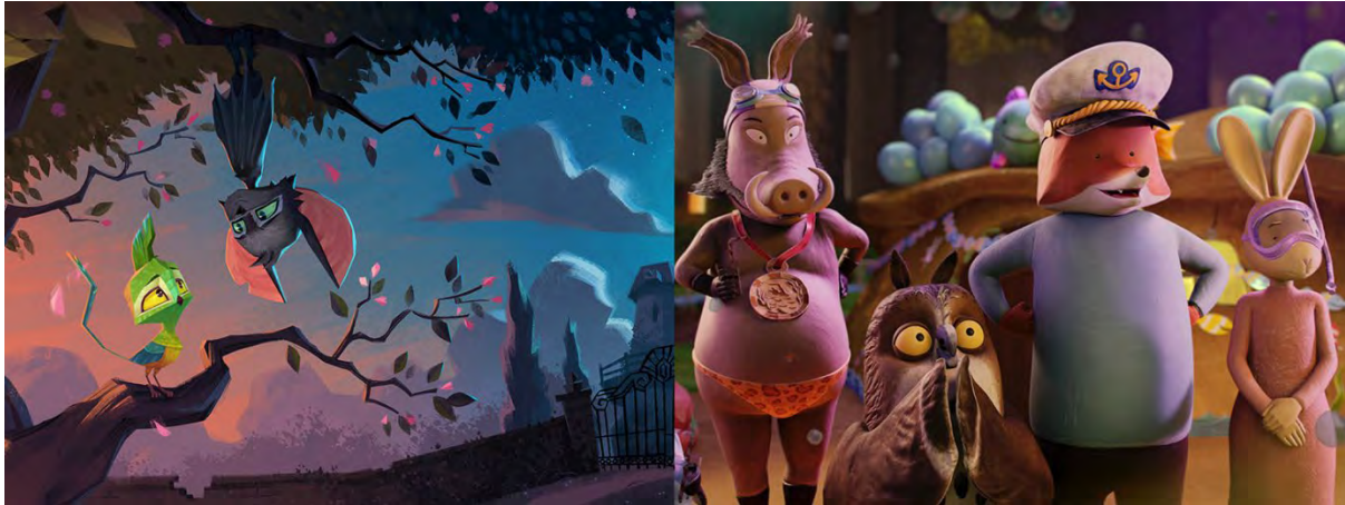
Victor Vleermuis - Vos en Haas Redden het Bos