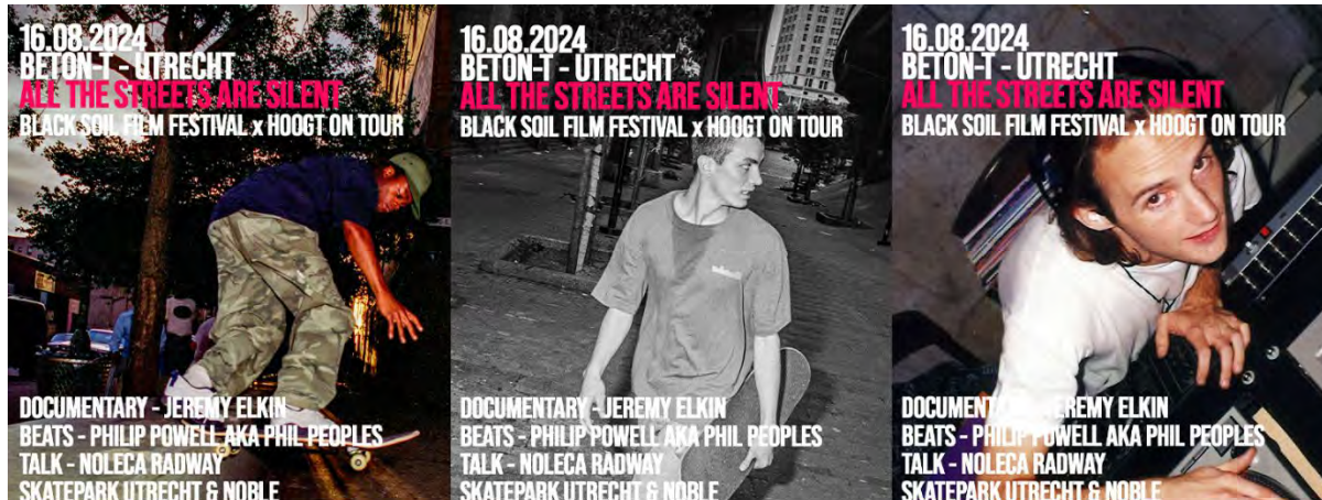
Instagramcampagne All the streets are silent

Het resultaat was 1,4% meer bezoekers aan ons filmprogramma dan in 2023. Als we ons online filmpubliek (Picl) meenemen, dan is de groei zelfs 8% ten opzichte van 2023.